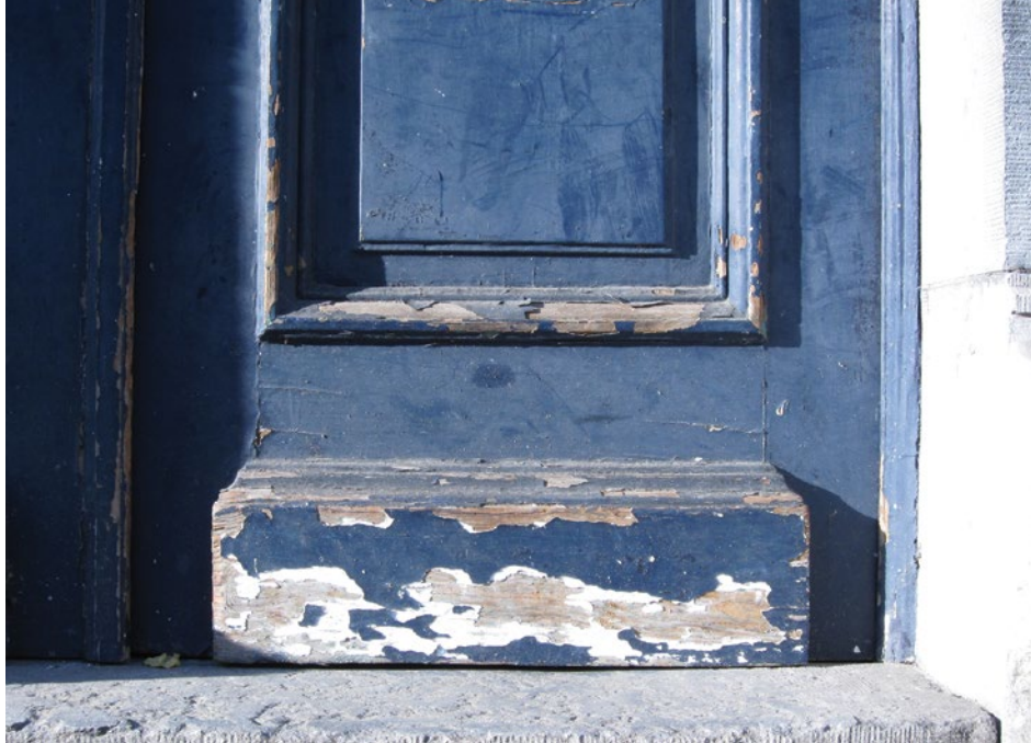
Afgebladderde verf onderaan de deur