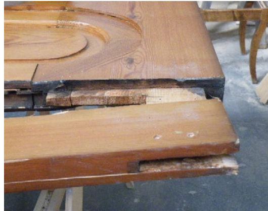
Demontage van een te vervangen stijl.

Het is ook mogelijk om in het atelier een deur die op de vloer schuurt omdat de verbindingen hebben losgelaten, te herschoeien.