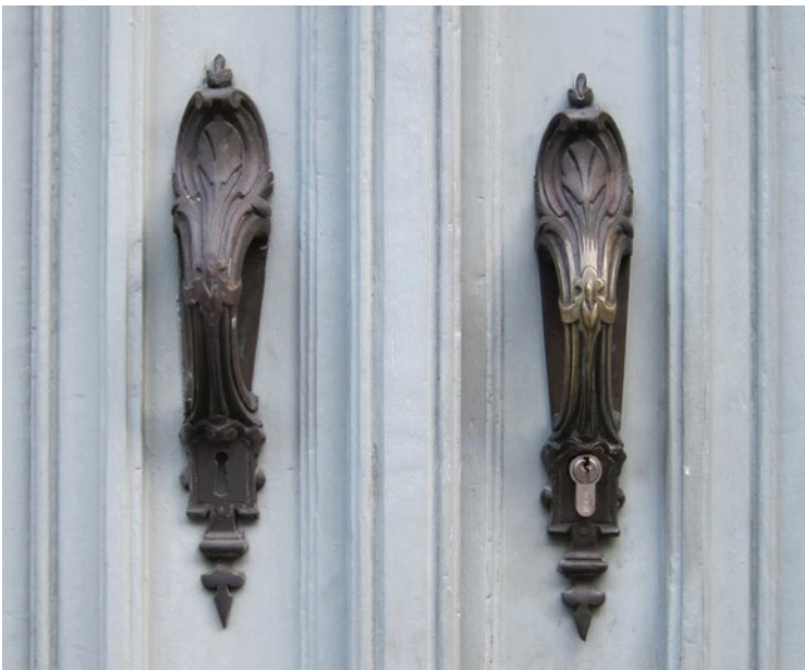
Oud slotwerk waarvan het sleutelgat vergroot werd voor het plaatsen van een cilinder.

De vervanging van oude sleutelgaten door moderne, zogenaamde veiligheids-sleutelgaten, geeft een esthetische waardevermindering en is in de meeste gevallen nutteloos.