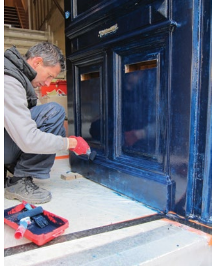
Schilderen met verfkwast

In het kader van de restauratie van beschermde gebouwen worden onderzoeken gedaan door de verschillende verflagen één voor één vrij te maken, totdat de oorspronkelijke kleur aan het licht wordt gebracht. Deze onderzoeken, stratigrafische studies genoemd, worden zelden uitgevoerd voor de meer gewone gebouwen.