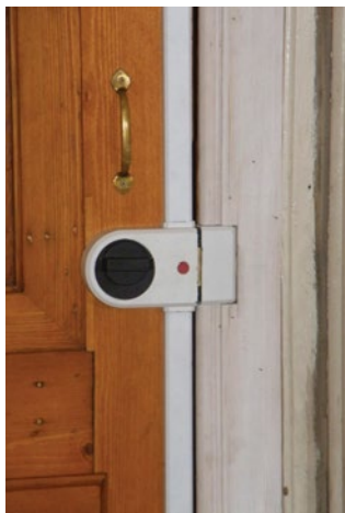
Slot met drie grendelpunten.