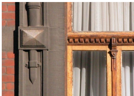
Venster met versierde regel, rond 1900. Brugmannlaan 264, Ukkel.

Historische vensters worden gekenmerkt door een subtiele aanpassing van de breedte van hun profielen aan de afmetingen van de opening. Het schrijnwerk, vervaardigd van hoogwaardige houtsoorten, meestal eik, is ontworpen om de tijd te doorstaan op voorwaarde dat ze een aangepast onderhoud krijgt. Vele houten vensters die meer dan 100 jaar geleden werden geplaatst, zijn nog in uitstekende staat. Vooraleer u opteert om uw historisch schrijnwerk te vervangen, is het interessant de waaier van technieken voor het behoud en het verbeteren van hun prestaties na te gaan.