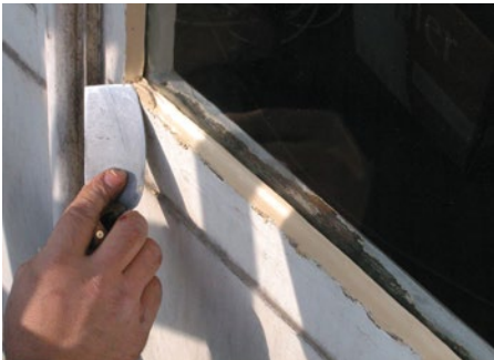
Vervanging van de beschadigde stopverf.

De onderdelen die niet zichtbaar zijn wanneer het venster gesloten is, moeten onbedekt blijven, om verdikkingen te voorkomen die hinderlijk zijn bij het openen en sluiten van het venster. De waterafvoergaten onderaan het raam moeten beschermd worden bij het schilderen, zodat ze niet verstopt raken. De spanjoleffen en scharnieren worden beter niet geschilderd zodat ze niet vast komen te zitten.