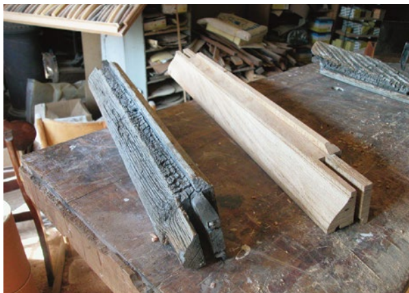
Exacte reproductie van een te vervangen onderdeel (waterlijst).

De restauratie is aanbevolen voor schrijnwerk dat van bijzonder belang is, of wanneer slechts enkele elementen in de gevel beschadigd zijn.