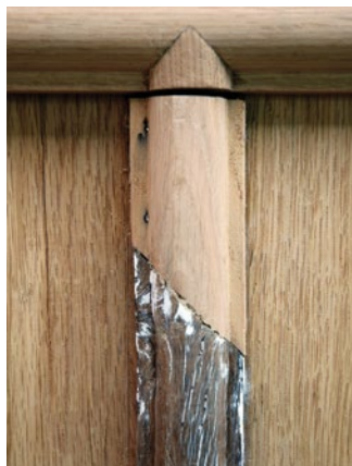
Plaatselijk herstellen van elementen