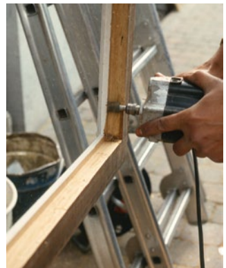
Plaatsing van dubbel glas met vergroting van de glassponning.