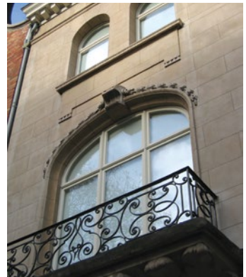
Hedendaags schrijnwerk waarbij de buitenkant het uitzicht van de oorspronkelijke ramen reproduceert.

In tegenstelling tot de oude ramen waarbij elk onderdeel geïndividualiseerd is, getuigt het hedendaags schrijnwerk van een streven naar maximale standaardisatie. Het is echter mogelijk, vooral als men voor houten ramen opteert, om de breedte van de oorspronkelijke profielen te respecteren. Aan de buitenkant kunnen lijsten worden aangebracht om het specifieke reliëf van oude ramen te reconstrueren. Het resultaat mag er zijn in geval van ramen met relatief eenvoudige vormen, maar wanneer de tekening van het venster zeer geraffineerd is, zal enkel een identieke kopie deze zorgvuldig kunnen reproduceren.