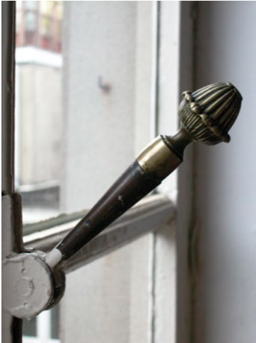
Krukspanjolet met versiering van papyrusbloem, rond 1875. Schotlandstraat 65, Sint-Gillis.