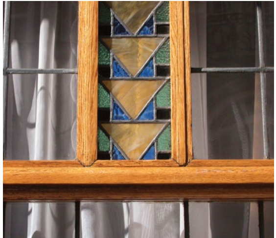
Venster met art-deco glas-in-loodraam, 1922. Atrebatenstraat 125, Etterbeek.