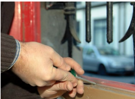
Vrijmaken van de afvoergaten aan de onderkant van het raam.