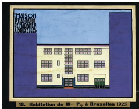
Woning van mevr. Petrucci, J.-J. Eggericx, 1925. De Praeterestraat 18, Elsene. Verz.AAM.