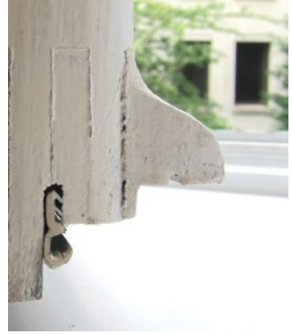
Soepele dichtingsstrip aangebracht door een schrijnwerker.

Een eerste methode bestaat erin de sponning van het schrijnwerk te verbreden zodat er dubbel glas in past. Er bestaan ook aanpasbare profielen waardoor het dubbel glas kan ingebracht worden zonder het venster te verminken. In tegenstelling tot de eerste methode, brengt deze techniek een verkleining van de glasoppervlakte van het venster met zich mee.