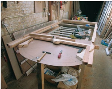
Kopie van oud venster in uitvoering in het atelier.