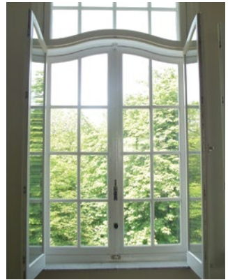
Plaatsing van een dubbel venster.