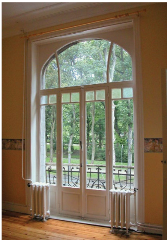
Vensterdeur, rond 1900. Pantheonlaan 59, Koekelberg.