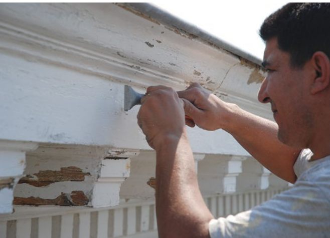
Voorbereiding van de ondergrond vóór het schilderen.

vochtigheid in het hout mogelijk te maken. De keuze van wit of een heldere kleur beantwoordt het best aan het subtiele spel van schaduw en licht op de ornamenten en het lijstwerk van de klassieke daklijst. De Jugendstil en art deco hebben beroep gedaan op meer gevarieerde kleuren. Een analyse van de oude verflagen (stratigrafie) kan de keuze van de kleur helpen bepalen.