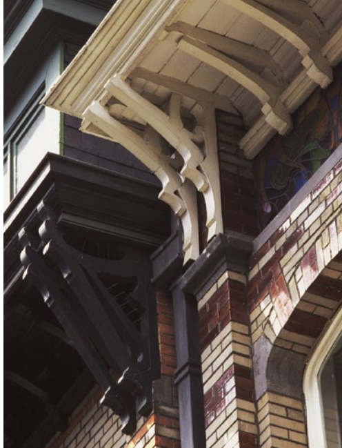
Gustave Strauven, 1899. Saint-Quentinstraat 30 en 32, Brussel, foto AAM.

Rond 1900 veranderen sommige Jugendstilarchitecten compleet de vorm van de daklijst: ze steekt voortaan breeduit boven de gevel, neemt een golvende tekening aan en rust soms op consoles in smeedijzer... Ze beschermt vaak sgraffiti (techniek van de decoratieve muurschildering) of versieringen in keramiek die leven brengen in het bovenste deel van de gevel. In de periode tussen de twee oorlogen blijft de daklijst een belangrijke component van de art deco gevels.